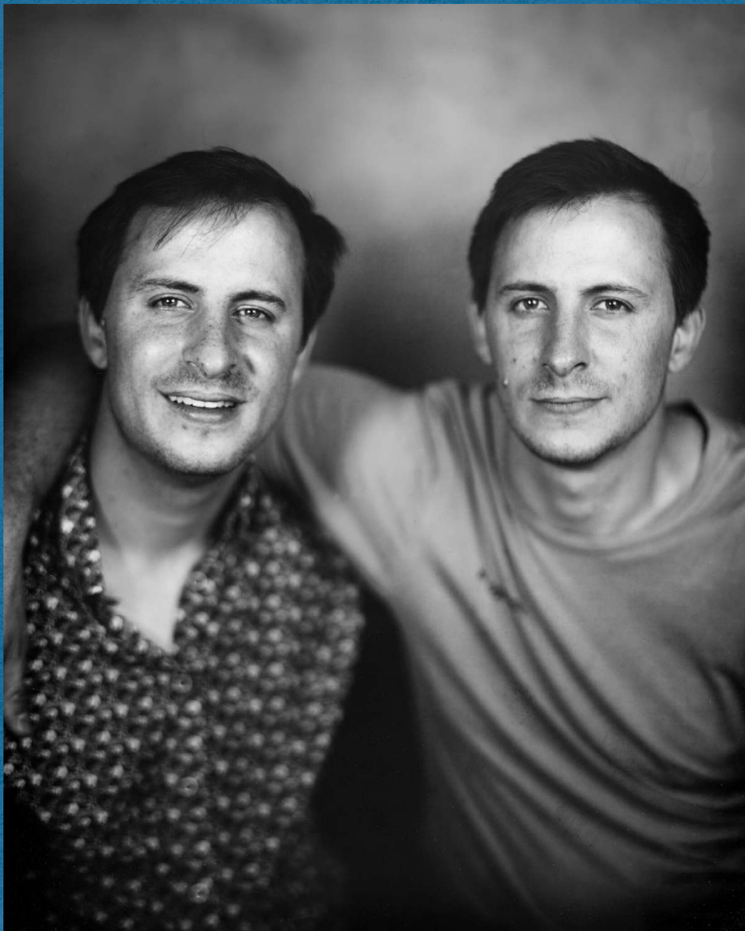
Taille réelle 8x10" (20x25cm)