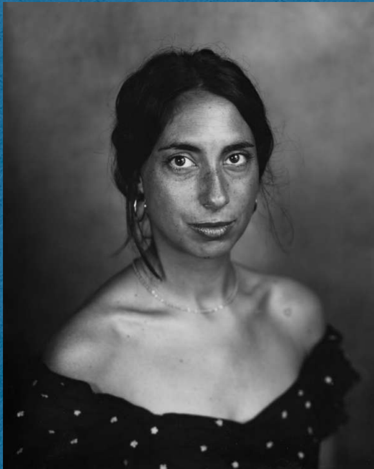
Taille réelle 4x5" (10x13cm)