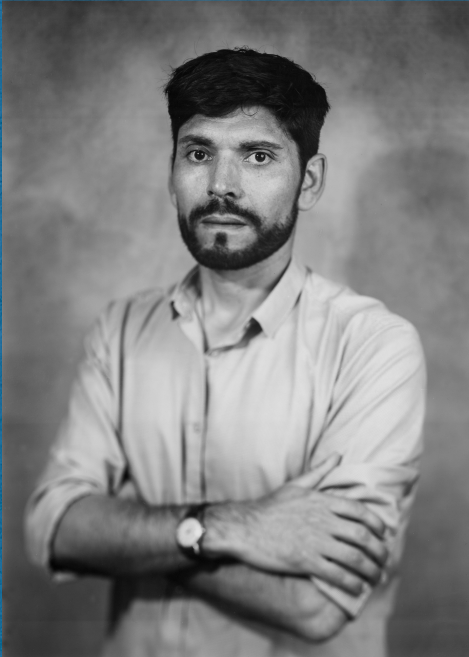
Taille réelle 5x7" (13x18cm)